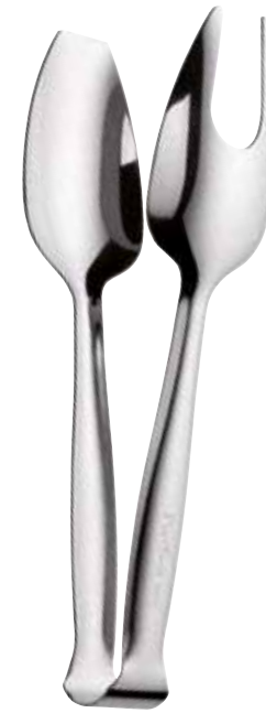
Molla servizio Buffet

Cake tongs Pince à gâteau Gebäckzange Pinza para pastel