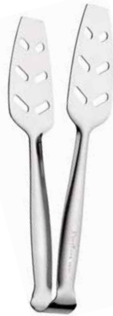
Molla dolce Buffet

All purpose tongs Pince universelle Universalzange Pinza universal