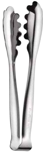
Molla universale Buffet

Vegetables tong Pince à légumes Gemüsezange Pinza para vegetales