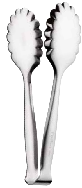
Molla pane Buffet

Serving tongs Pince de service servierzange Pinza servir