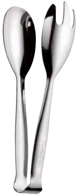
Molla verdure Buffet